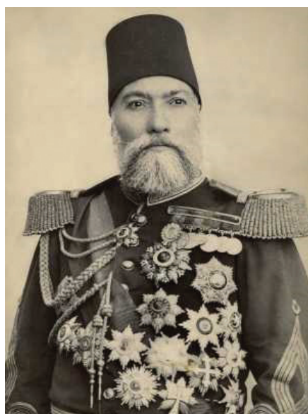
Osman pașa, prizonier în Vlașca