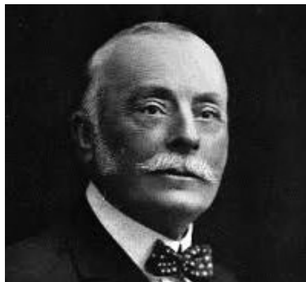
Alexandru Marghiloman

ales deputat în Colegiul I Buzău. A făcut parte din guvernele conservatoare, deținând funcțiile de ministru al Justiției (martie-noiembrie 1888; decembrie 1891-octombrie 1895), al Lucrărilor Publice (noiembrie 1888-martie 1889; noiembrie 1889-martie 1890), al Afacerilor Străine (iulie 1900-februarie 1901);