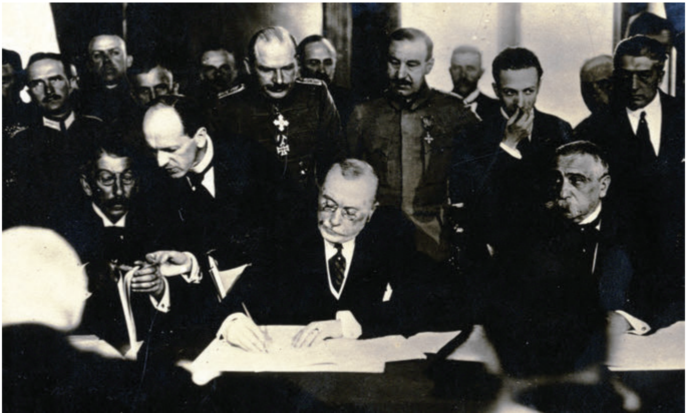
Prim-ministrul Alexandru Marghiloman semnează Tratatul de Pace de la București