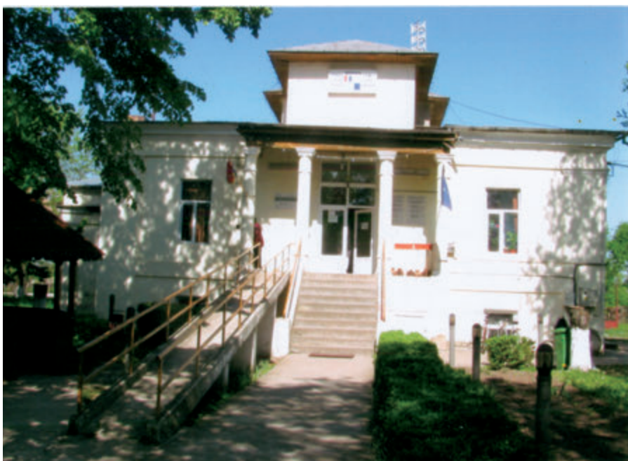
Clădirea din localitatea Arsache (astăzi Vedea), unde a fost ținut prizonier Osman Pașa, în drumul lui spre Giurgiu și București, în iarna anului 1877