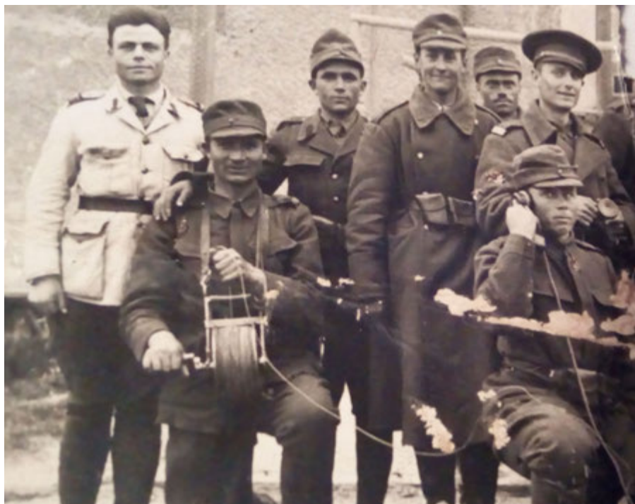
„Amintire din 15.04.1939, Regimentul 34 Infanterie, Compania Specialitati (Telegrafie + Telefonie).”

trebuia să circule și militari, și căruțe, și cavalerie, și tunuri tractate de cai, și tot ce se afla în zonă. În acea derută din noapte, pericolul cel mai mare îl reprezentau tunurile, care erau tractate de cai, iar când scapa la vale câte un tun, căci era panta mare, aduna cu el tot ce întâlnea în cale și le ducea în Don. Cum să scape fiecare din această situație. Pe mine m-a ajutat Dumnezeu și un consătean, să nu rămân pentru totdeauna la Cotul Donului. În acea noapte, cu o lună ca în basme, în jurul orei 2 am întâlnit un consătean din comuna Scânteia, care era aghiotant la o mare unitate, și care conducea o căruță cu doi cai frumoși și puternici, având misiune specială. După mai multe discuții, împreună cu el, am reușit să trecem dincolo de încercuire, pentru că se făcuse o „breșă” prin care au trecut