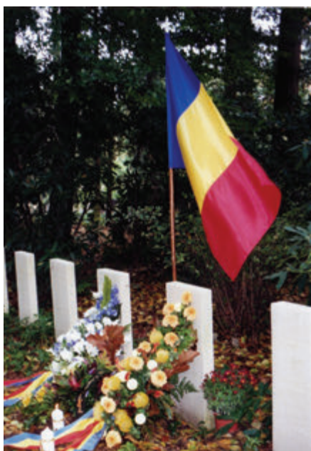
În Cimitirul Eroilor de la Leusden-Amersfoort