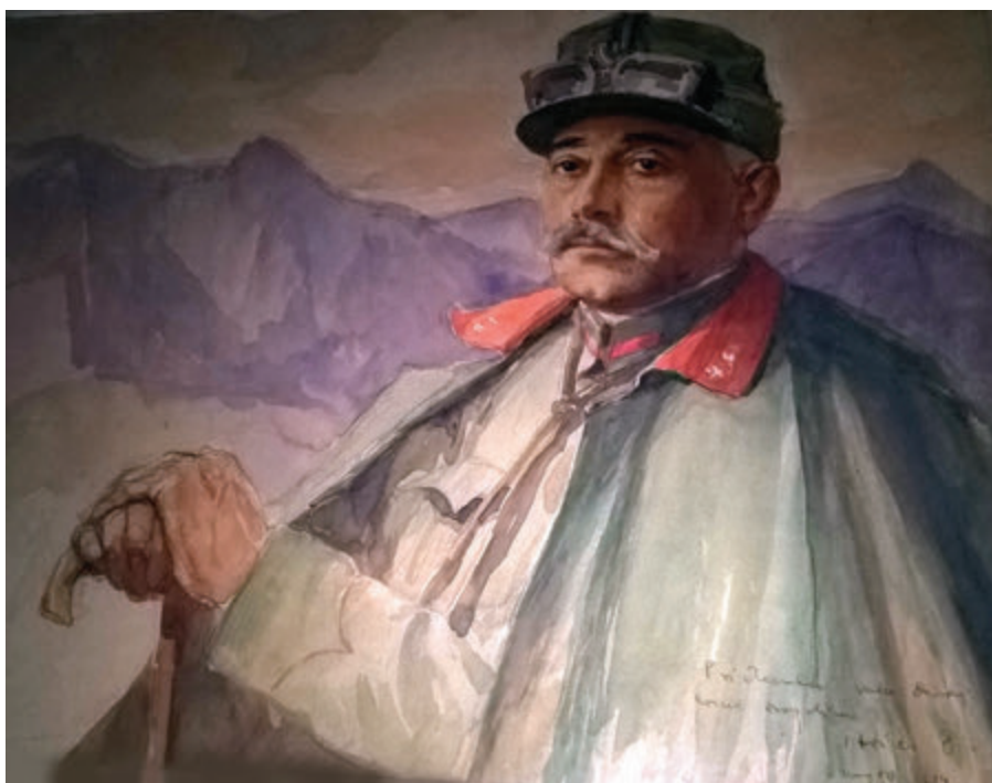
Generalul Ioan Dragalina. Portret de D. Stoica