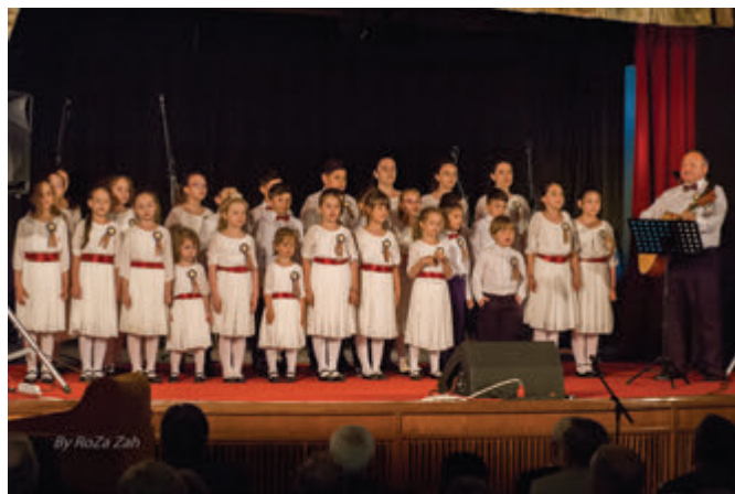
Grupul de copii „Cornețenii”, invitații ANCERM

O manifestare - evocare, un gest omagial al Recunoștinței pentru cei care și-au dat viața pentru noi și pentru țara în care trăim! ■