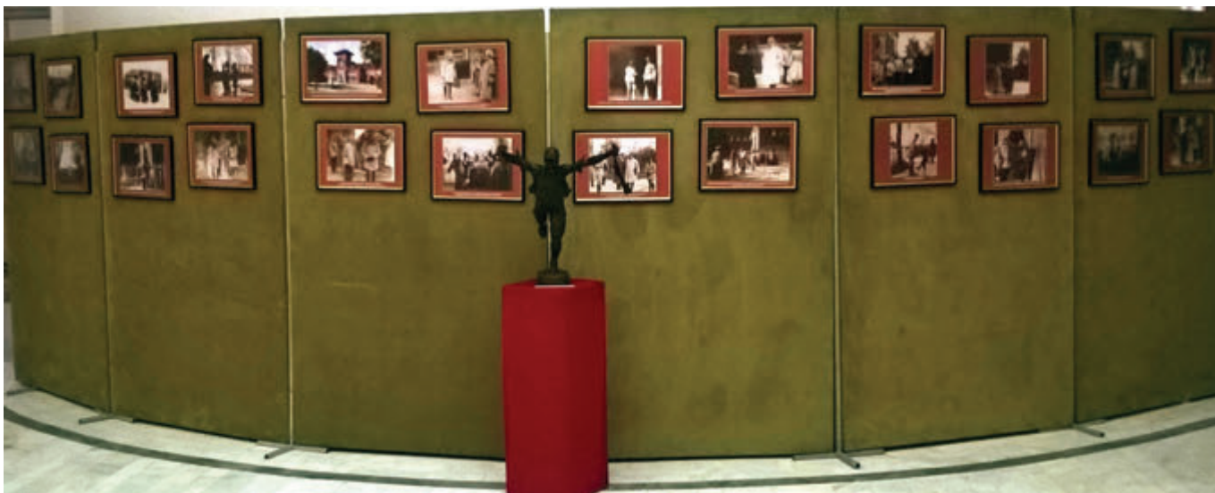
Expoziția de fotografii inedite, propusă de Cercul Militar din Bârlad, înfățișând pe regele Ferdinand, principele Carol și membrii Misiunii Militare Franceze în popasul lor bârlădean spre Iași, în 1917.

și cele patru tablouri expuse, care-l înfățișează în ipostaze diferite pe generalul Ioan Dragalina, care a făcut jertfa supremă pentru înfăptuirea României Mari, în toamna anului 1916. Lucrările respective au fost: Generalul Dragalina la un post de observație cu câinele său Leul (inv. 1737), Generalul Dragalina rănit la brațul stâng, aflat în spitalul de campanie (inv. 1738), Generalul Dragalina - portret cu binoclu (inv. 1739), Generalul Dragalina cu bastonul (inv. 1741). Toate aceste