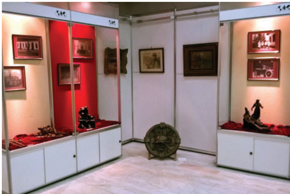
O imagine de la expoziția „Războiul Reîntregirii prin exprimări artistice”