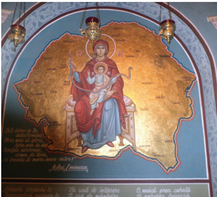
Harta României Mari pictată la Așezământul Românesc de la Ierusalim