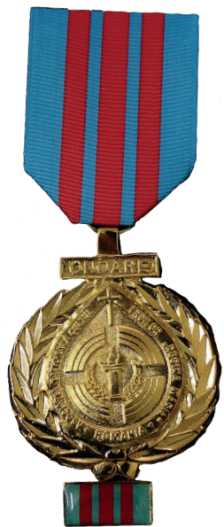
Emblema de Onoare a Asociației Naționale Cultul Eroilor „Regina Maria”