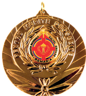
Medalia „Pentru Merite Deosebite”, acordată de ANCE „Regina Maria”