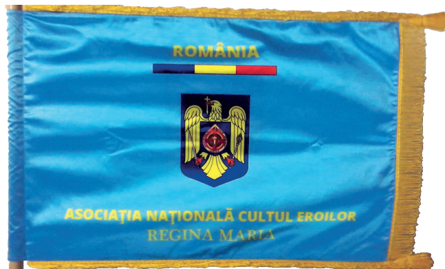
Drapelul Asociației Naționale Cultul Eroilor „Regina Maria”